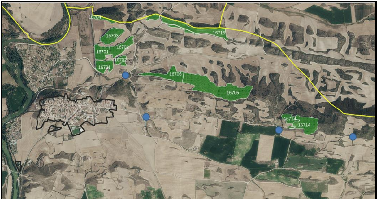
Detalle de la zona de aprovechamiento: vista de los aparcamientos de cazadores en las inmediaciones del aprovechamiento.

En las inmediaciones de las masas objeto de aprovechamiento se encuentran varios aparcamientos de caza. Estas zonas no deberán ser utilizadas como cargadero para que puedan ser utilizadas por los cazadores durante la época de caza.