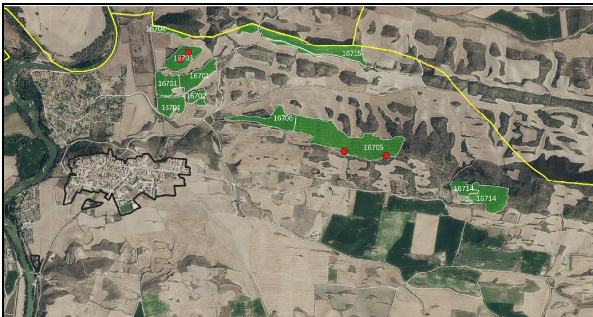
Detalle de la zona de aprovechamiento: vista de las palomeras en el interior de las masas 16703 y 16705.

Tanto las Masas 16703 y 16705 presentan palomeras en su interior, por lo que se deberán dejar a su alrededor algunos pies que las cubran. Una vez adjudicado el pinar, Basozainak/Guarderío de Medio Ambiente procederá a delimitar con cintas la superficie arbolada que se deberá respetar. Dicha superficie será excluida del aprovechamiento forestal.