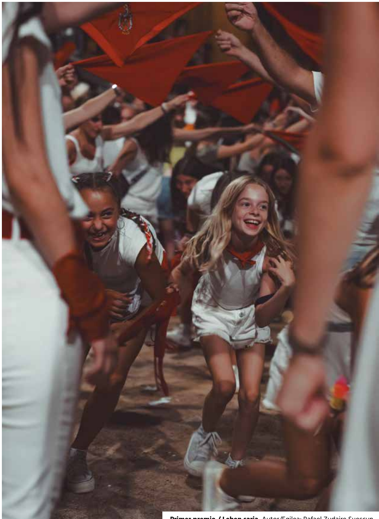
Primer premio / Lehen saria. Autor/Egilea: Rafael Zudaire Suescun