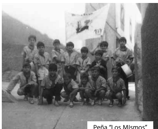
Peña "Los Mismos"