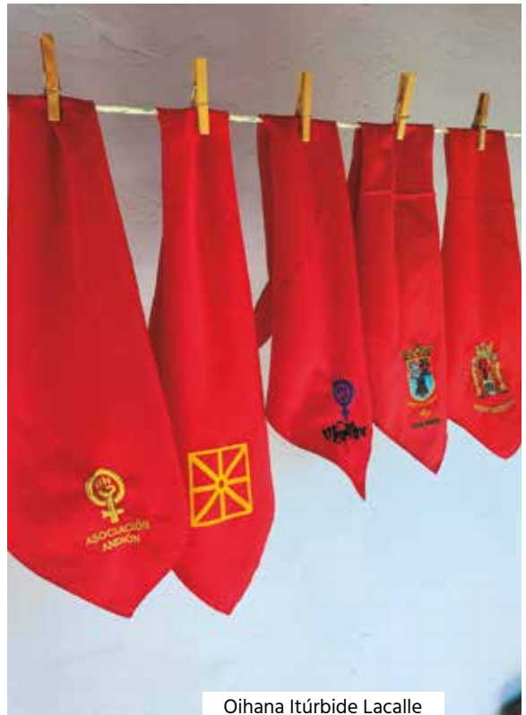
Oihana Itúrbide Lacalle

Otro proyecto a reanudarse tras el verano será la colocación de placas solares en la cubierta del