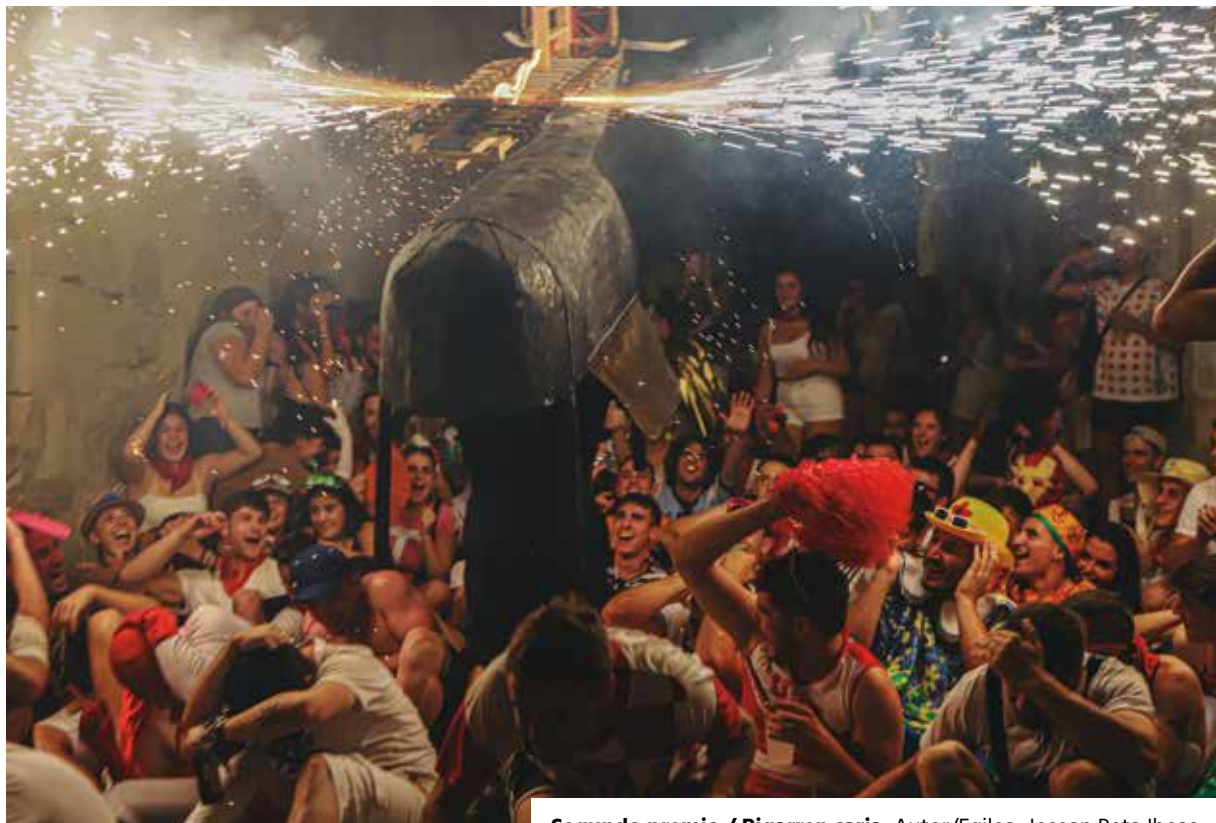
Segundo premio / Bigarren saria. Autor/Egilea: Josean Reta Ibeas