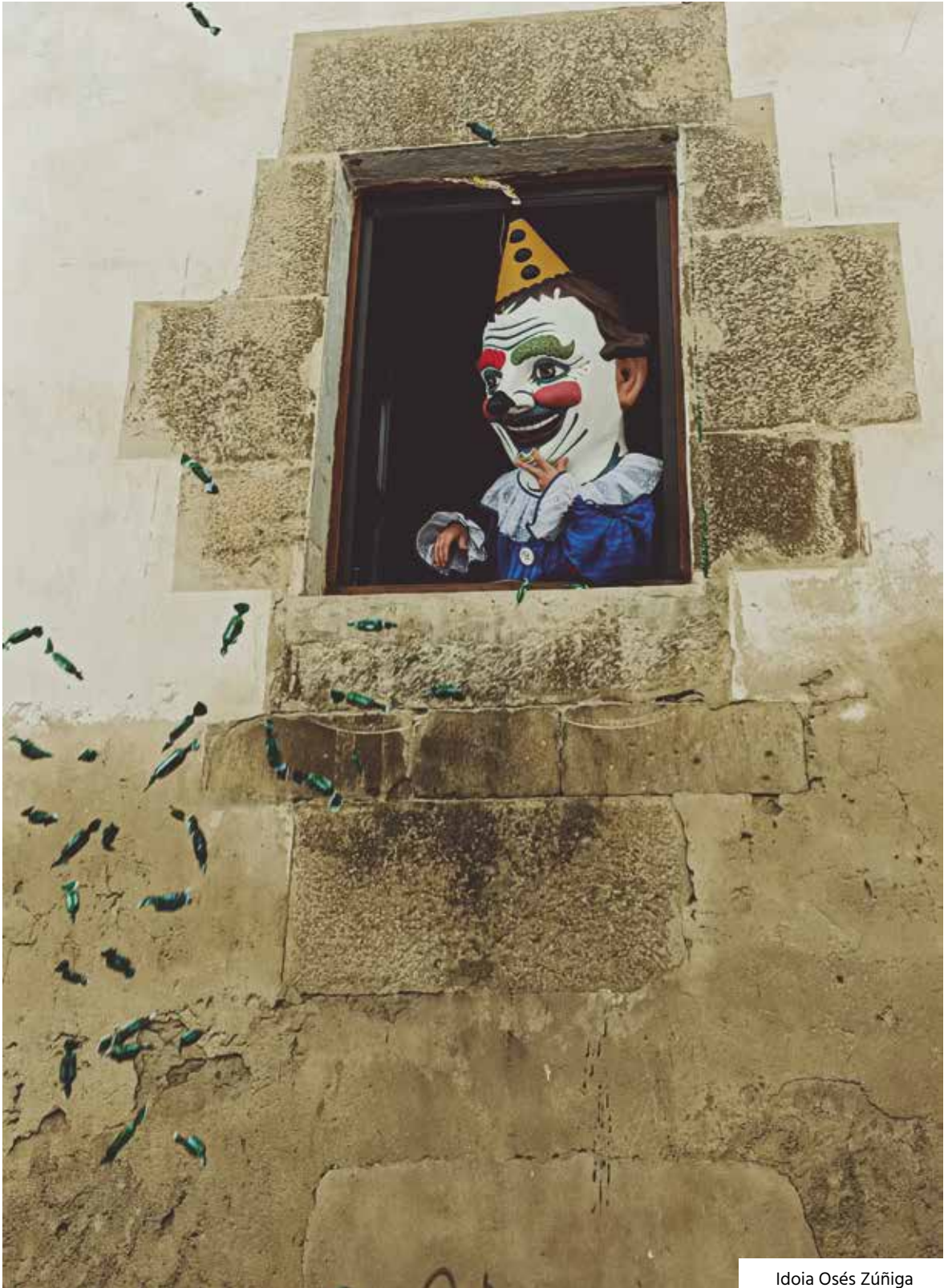
Idoia Osés Zúñiga