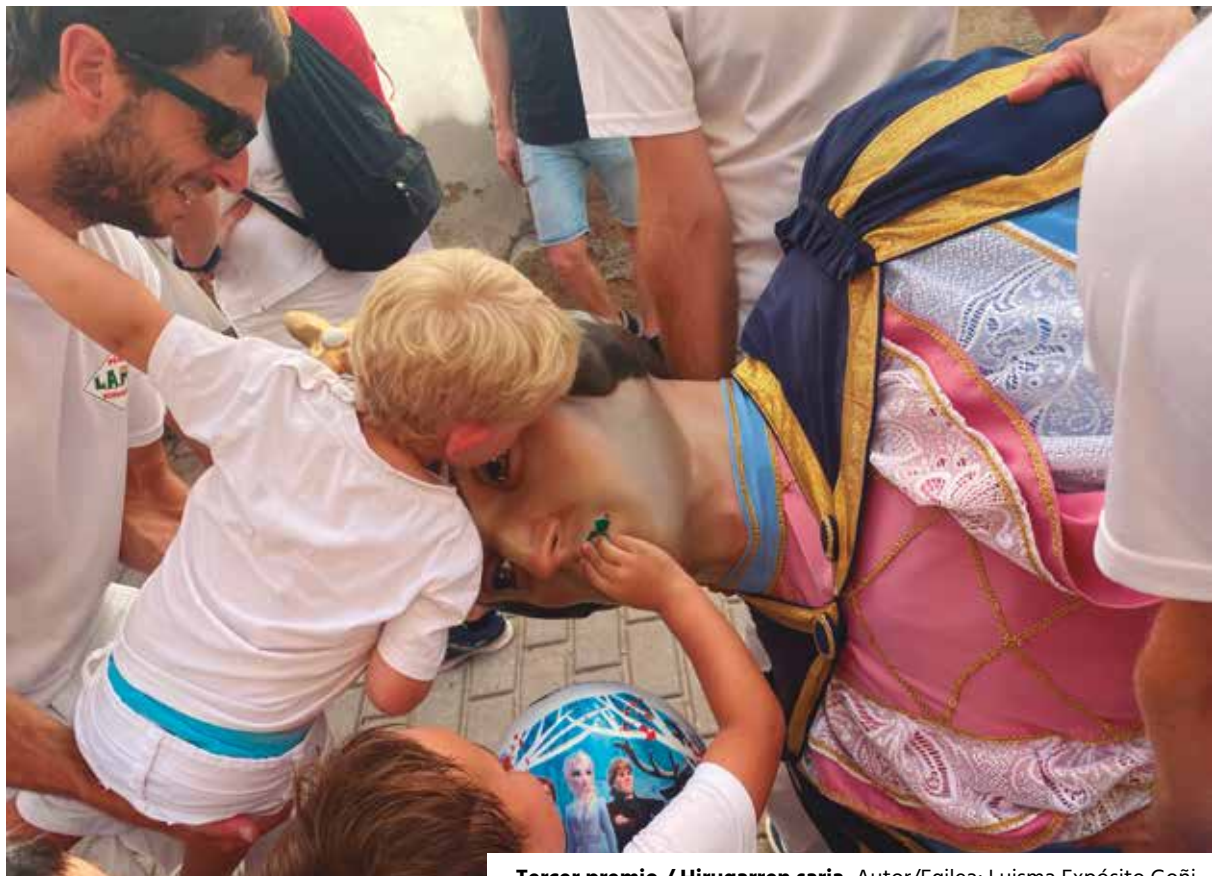
Tercer premio / Hirugarren saria. Autor/Egilea: Luisma Expósito Goñi